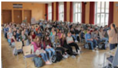
Preisübergabe im Geschwister-Scholl-Gymnasium in Fürstenwalde mit allen 5 Wettbewerbsklassen.