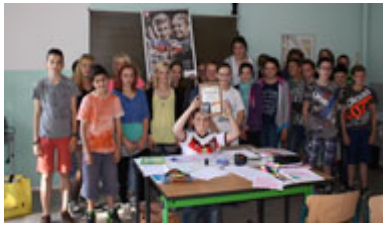
Die Klasse 8a der Oderbruch-Oberschule in Neutrebbin (Märkisch-Oderland) erhielt eine gefüllte Be-Smart-Tasche.