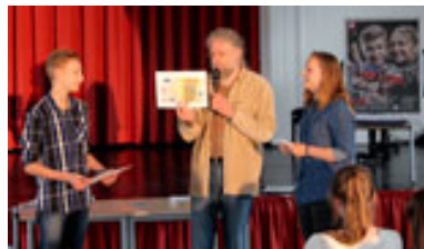
Der Brandenburger Landespreis mit 200 € ging für wiederholte Teilnahme an die Klasse 9d aus dem Geschwister-Scholl-Gymnasium in Fürstenwalde.