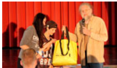
Die Klasse 8c vom Geschwister-Scholl-Gymnasium erhält eine Tasche mit vielen kleinen Preisen.