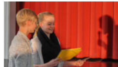
Die Klasse 7b des Geschwister-Scholl-Gymnasiums bekommt einen Gutschein für den Besuch von "Sealife" als Kreativpreis für ein tolles Video.