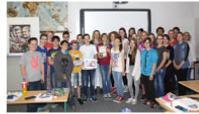
Die Klasse 7a des Rouanet-Gymnasiums in Beeskow (Oder-Spree) gewann 75 €.