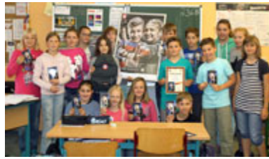
Die Klasse 5b der Grundschule Lindenbäumchen in Groß Lindow (Oder-Spree) erhielt eine gefüllte Be-Smart-Tasche.