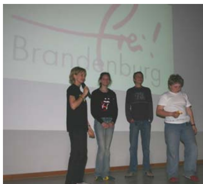
Verlosung der 4. – 10. Preise an die anwesenden Schulklassen