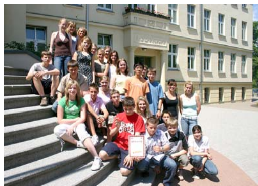
Der 1. Preis ging an die Klasse 8/2 des Fontane-Gymnasiums Strausberg und wurde persönlich an der Schule übergeben