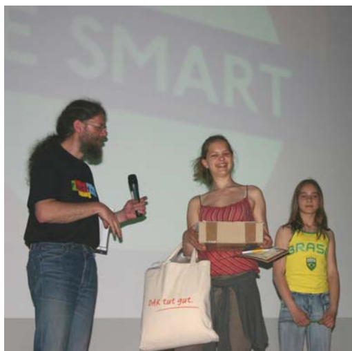
Der 1. Preis (WM-T-Shirts und Mini-Radios) wurde zunächst stellvertretend an die Schülerin einer Parallelklasse und dann später direkt an der Schule an die Siegerklasse übergeben (siehe unten)